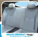
ohnehuch bilhædel / mugg / tankkainen vehko