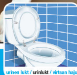
urinen lukt / urinlukt / virtsan haju

• ei peitå haju, vaan poistaa sen aiheuttajan • toimii 30 minuutissa