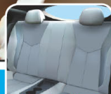
Tapicetas maloliente / Tecidos malcheirosos