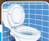
Olor a orina / Odor de urina