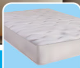
Cóchones / Colchões